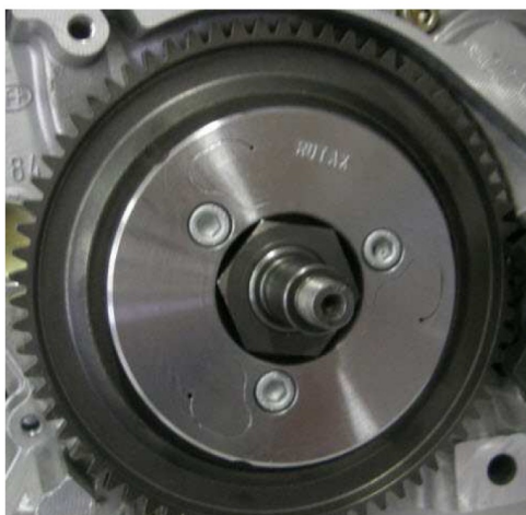
Starý typ odstředivé spojky č.: 659902