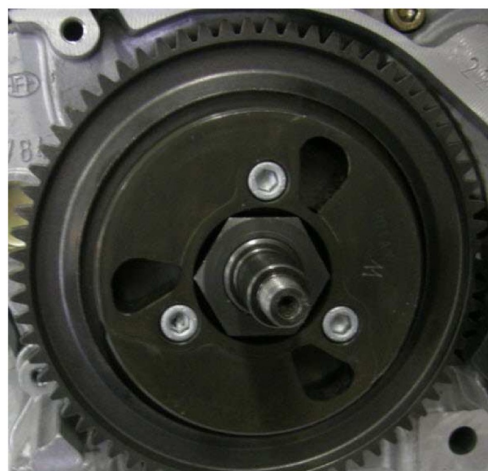
Nový typ odstředivé spojky č.: 659907